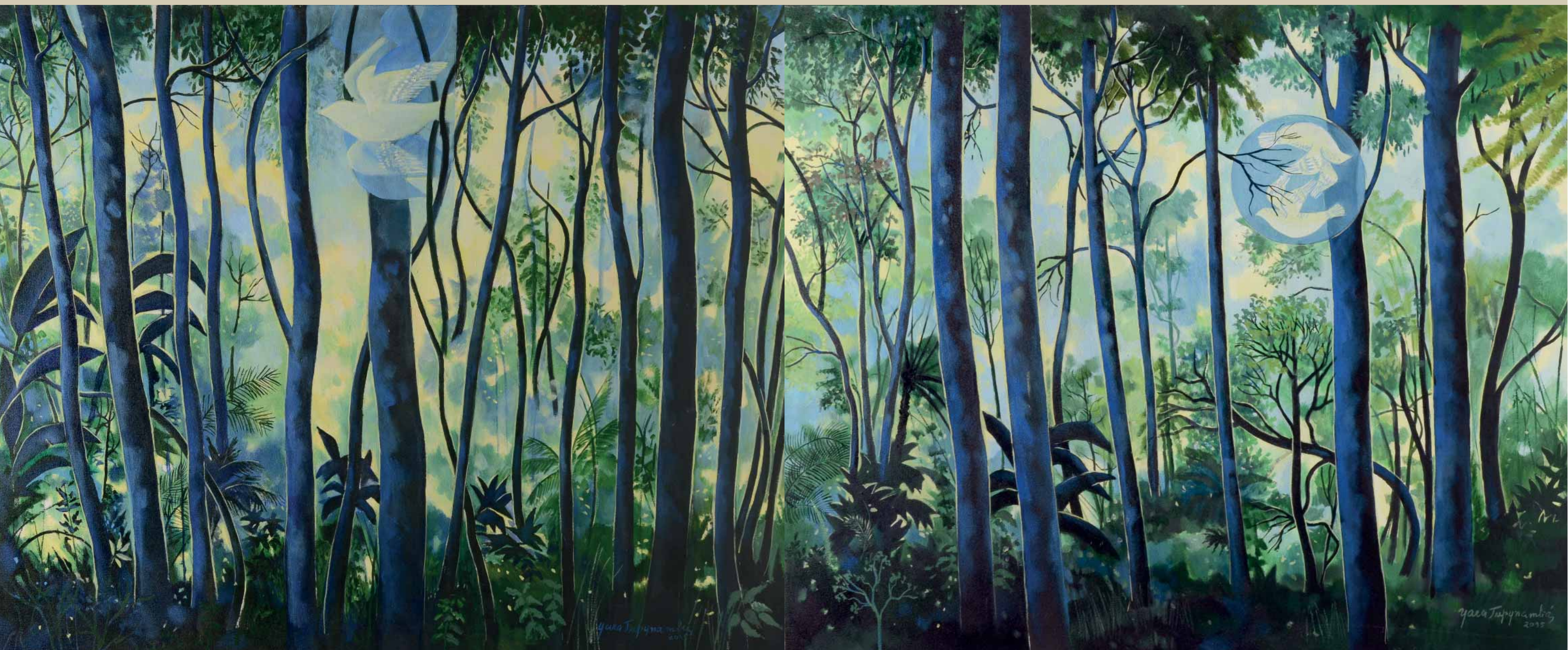
Vale do Rio Doce . Floresta e Grande Pássaro - Díptico 1 . Acrílico sobre tela . 120x100 cm . 2015 Coleção Yara Tupynambá