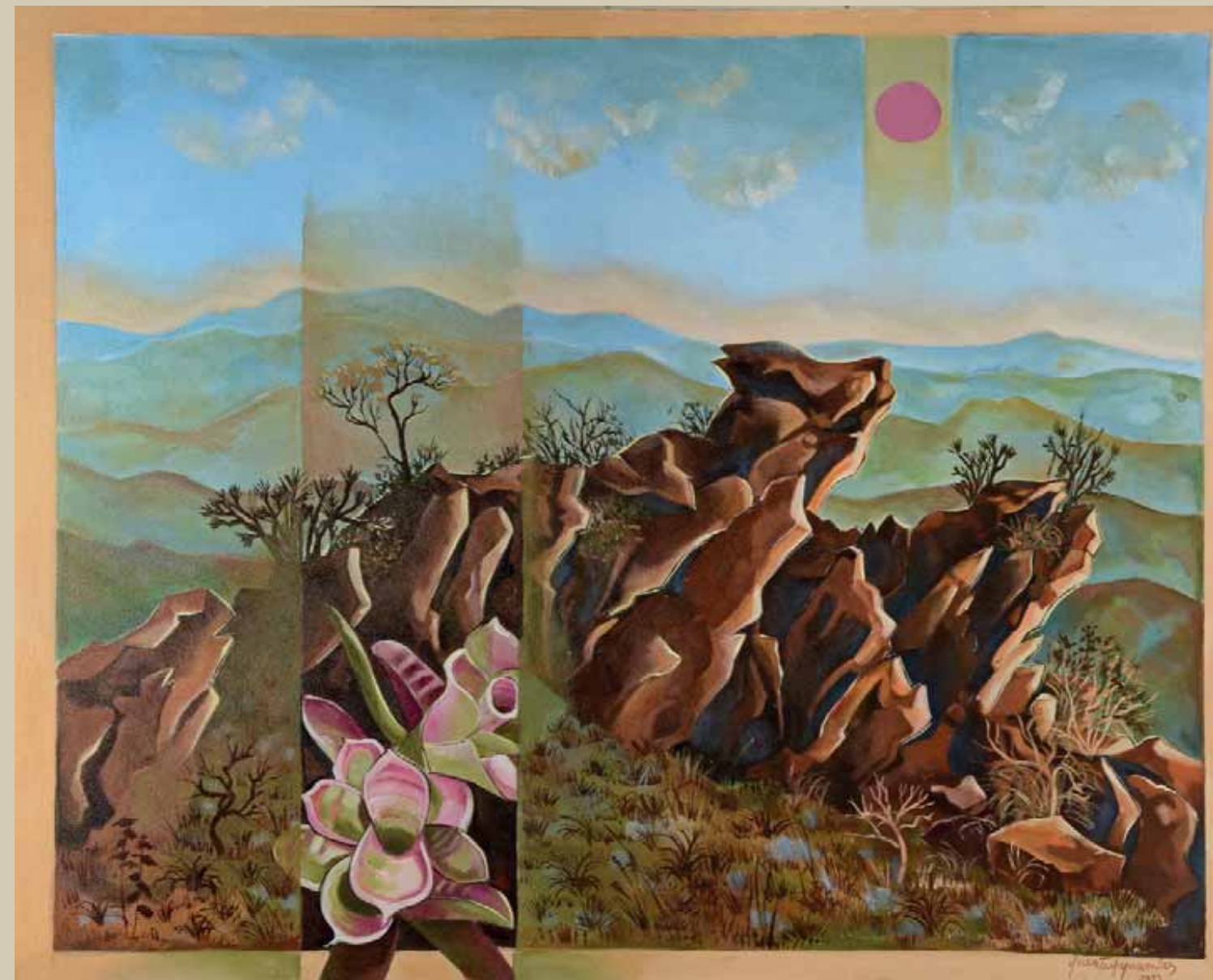
Serra do Cipó . Pedras no alto da serra . Acrílica sobre tela . 120x100 cm . 2015 Coleção Yara Tupynambá