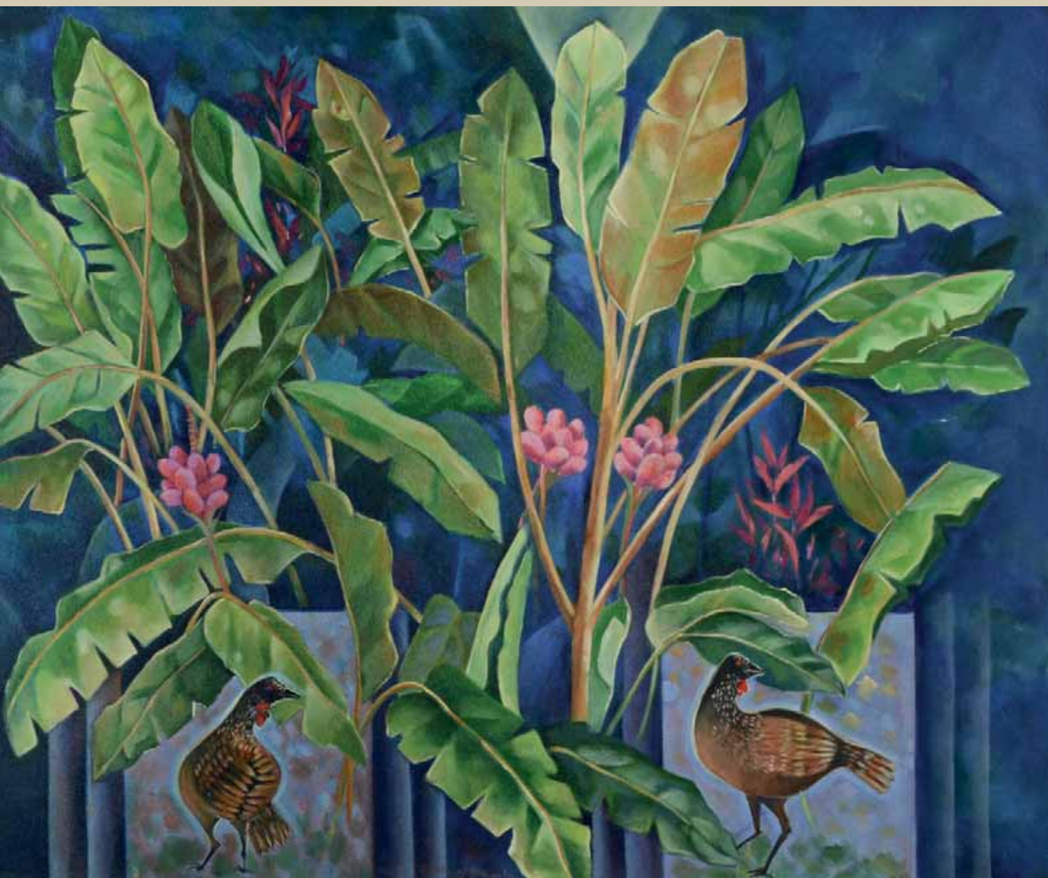
Inhotim . Inhotim VIII . Acrilica sobre tela . 120x100 cm . 2014 Coleção Yara Tupynambá