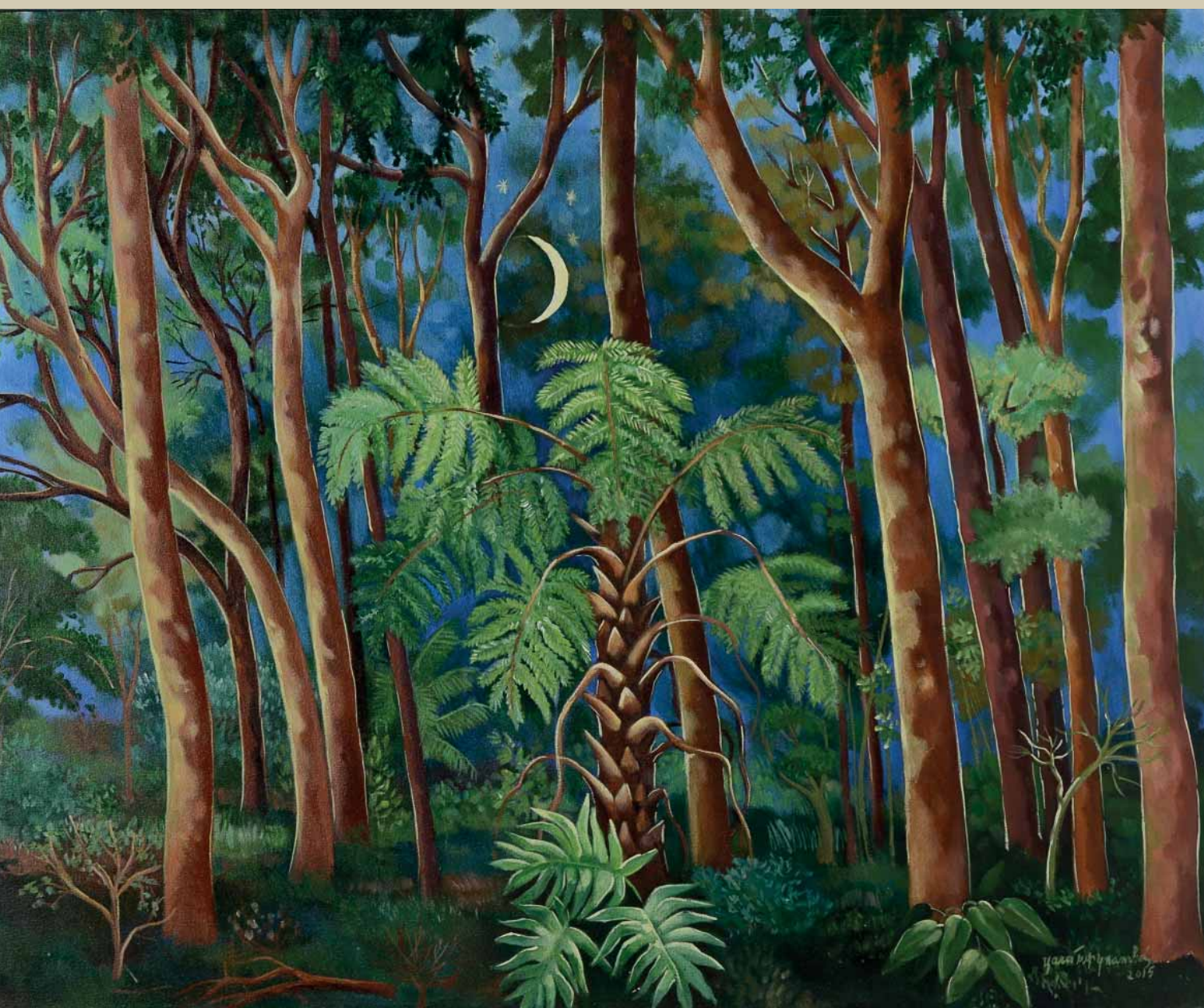
Vale do Tripuí . Vale do Tripuí Anoi-tecendo . Acrílica sobre tela . 120x100 cm . 2015 Coleção Yara Tupynambá