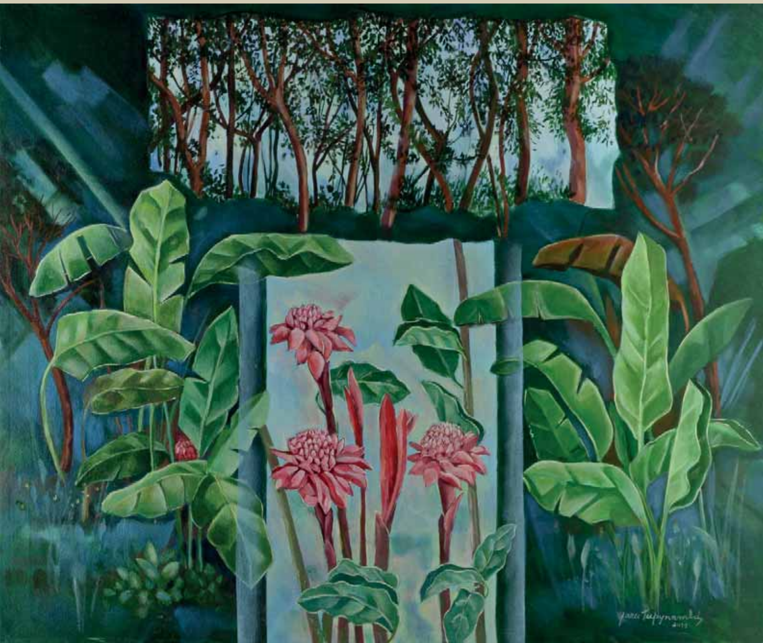
Inhotim . Inhotim XI - Flores e árvores . Acrílica sobre tela . 120x100 cm . 2015 Coleção Yara Tupynambá