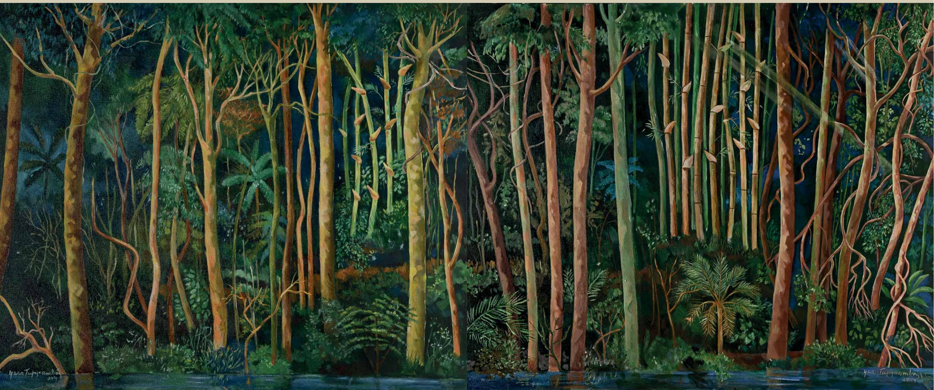
Vale do Rio Doce . Floresta Vale do Rio Doce Díptico 1 . Acrílica sobre tela . 120x100 cm . 2014 Coleção Yara Tupynambá