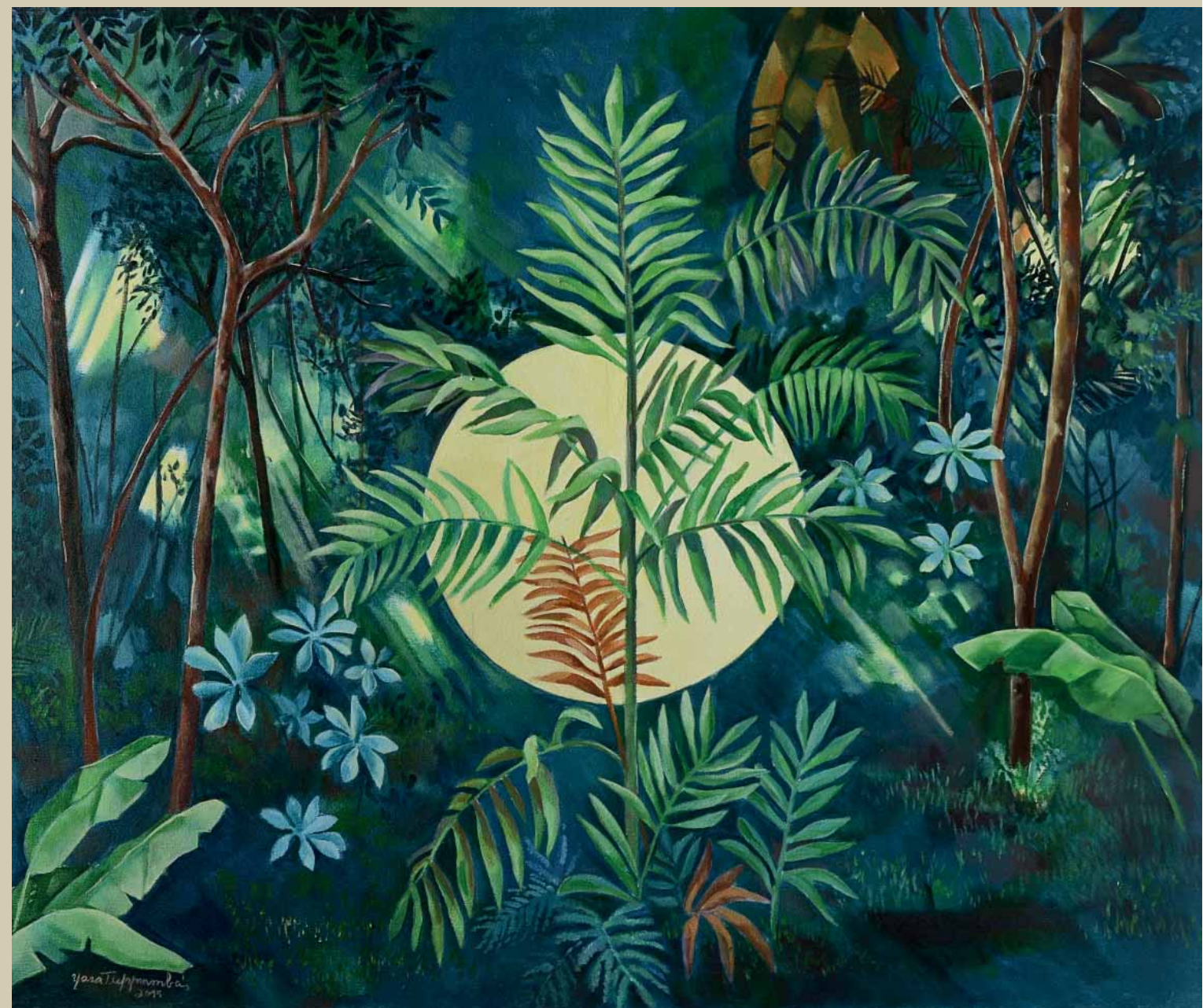
Inhotim . Inhotim X . Acrílica sobre tela . 120x100 cm . 2015 Coleção Yara Tupynambá