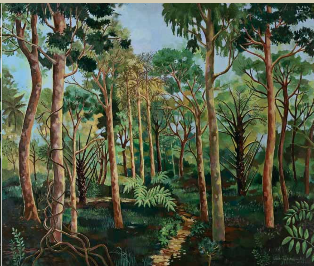
Tríptico 2 . Acrílica sobre tela . 120x100 cm . 2009 Coleção Ivan Vianna