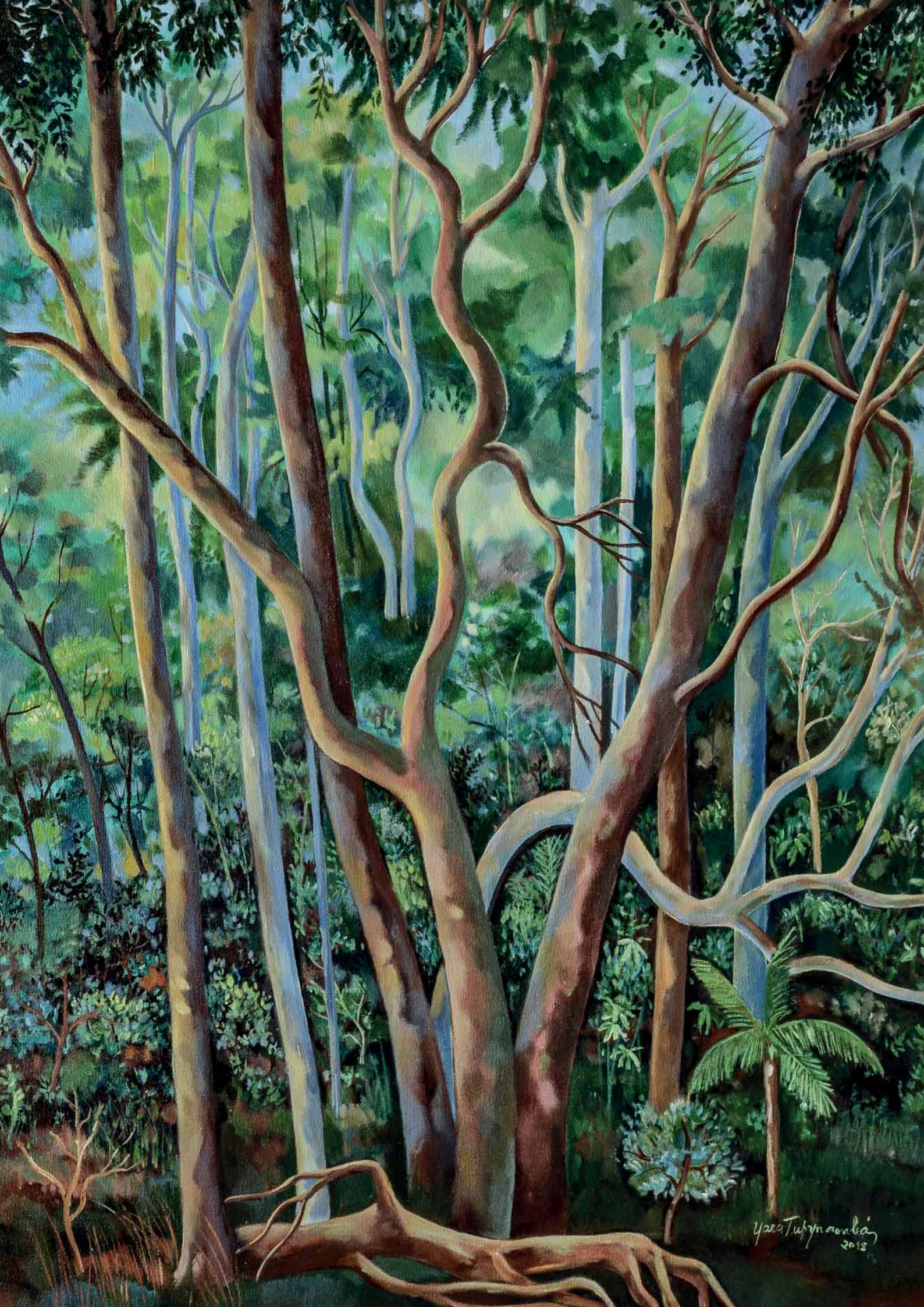
Vale do Rio Doce . Floresta e Árvore . Acrilica sobre tela . 100x120 cm . 2015 Coleção Yara Tupynambá