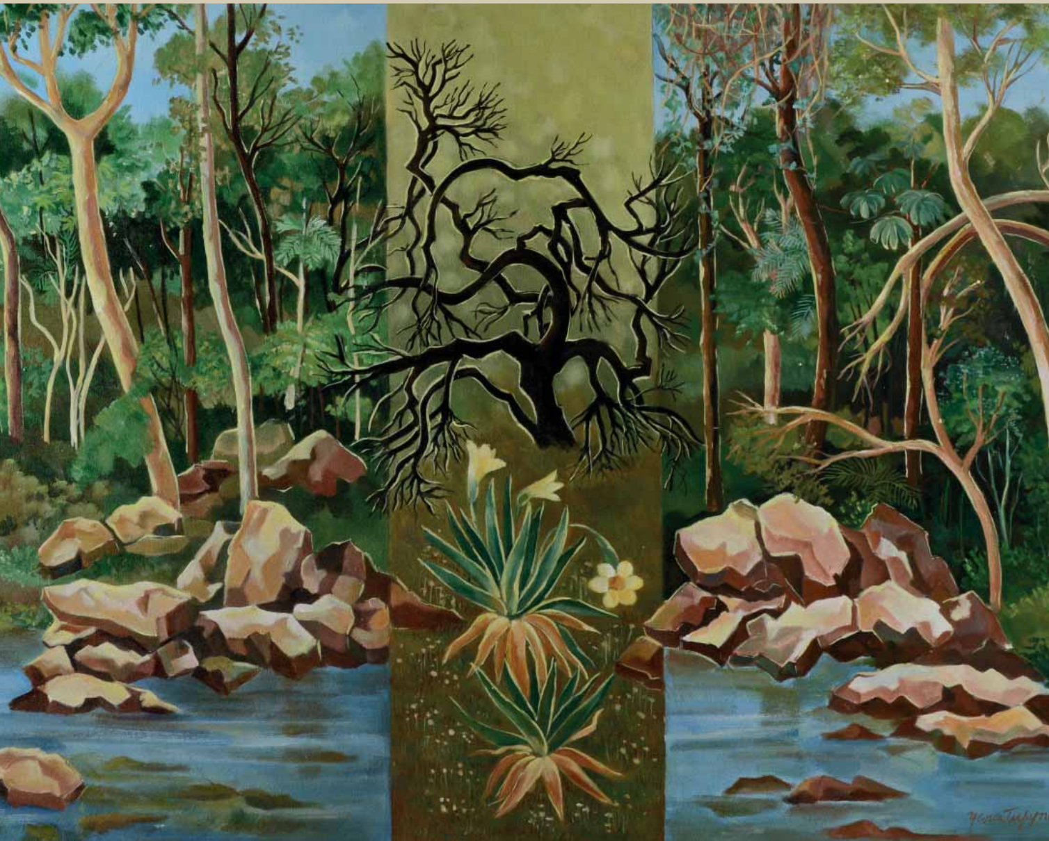
Serra do Cipó . Serra do Cipó perto da cachoeira . Acrílica sobre tela . 120x90 cm . 2015 Coleção Yara Tupynambá