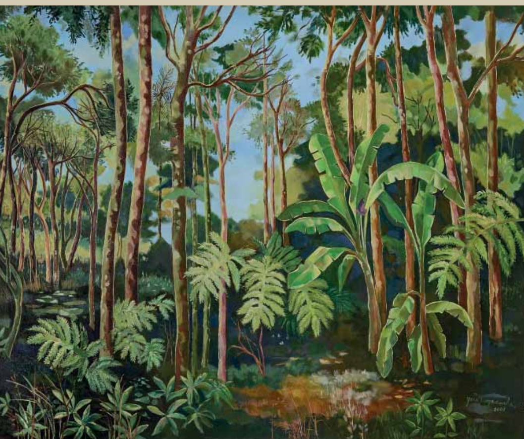
Vale do Rio Doce . Mata Vale do Rio Doce - Tríptico 1 . Acrílica sobre tela . 120x100 cm . 2008 Coleção Ivan Vianna